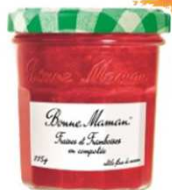
Fraise & Framboise