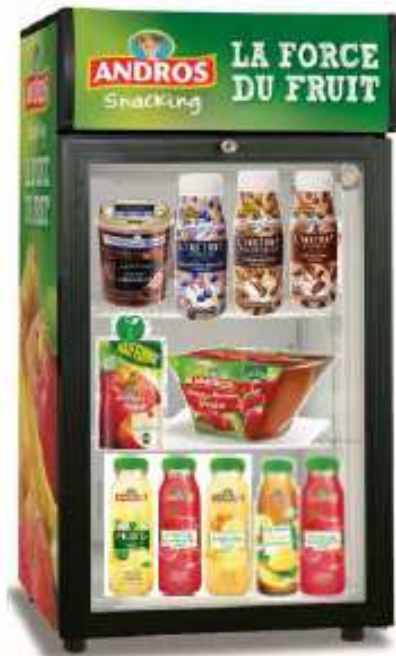
Modèle « comptoir »