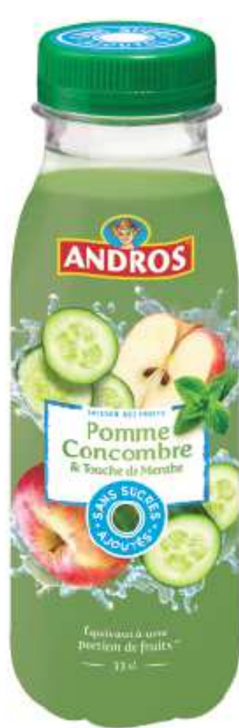
Pomme Concombre Menthe