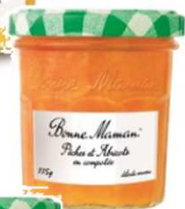
Pêches & Abricot